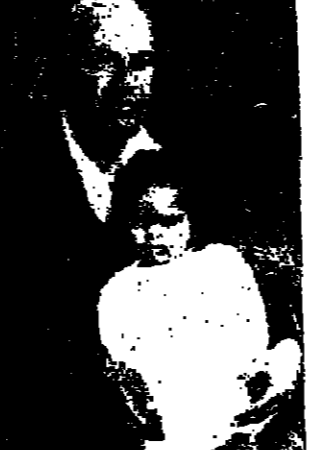
ما زال هناك الكثير قتل زرع القلوب

تفق النظر في وجه هذه الطفلة .. نربما كانت ابنك او ابنة قريب لك او جار .. اوربا ابنة اناس ممن قد ننحدرنا ان هذه الطفلة قد وجدت وحيدة تبكي في منطقة اريحا يوم ٧ حزيران الأسود بلا اهل . واخذها احد الذين شاهدوها الى بيته بعد ان اعياد البحث عن ذويها . وما زالت هذه الطفلة في رعاية نساء من مدينة القدس تنظر من يعرف عليها . فالرجو من اهل هذه الطفلة ان يعرف من يعرفهم شيئا الاتصال بجريدة «الدستور» للعمل على احضارها من القدس وتخليها اليهم .